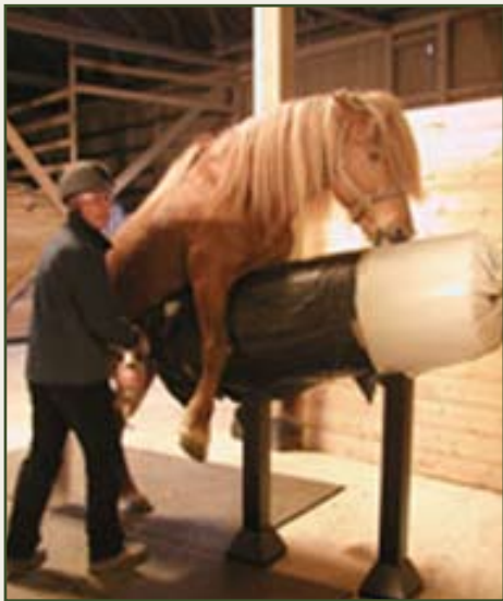
Samling på Feykir sommaren 2006